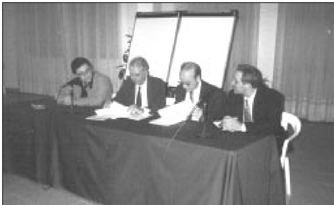
En la instantánea se recoge el momento de la firma del convenio.